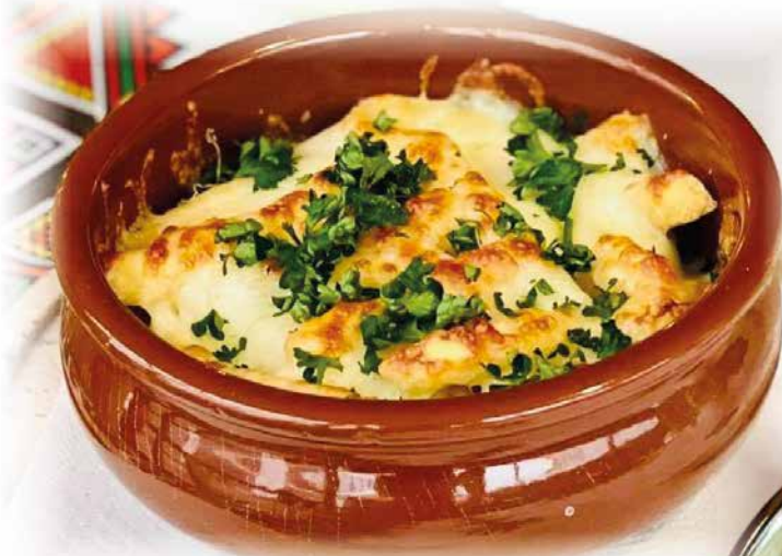
404) Hähnchen Wiener Art