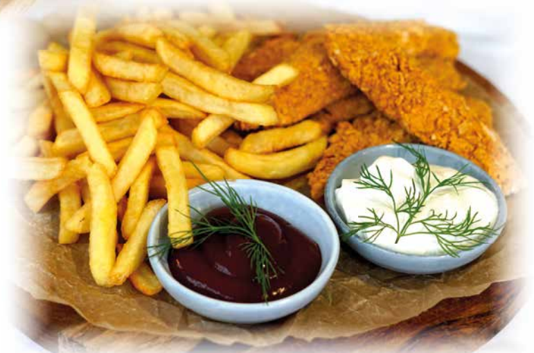
413) Hausgemachte Crispy Chicken