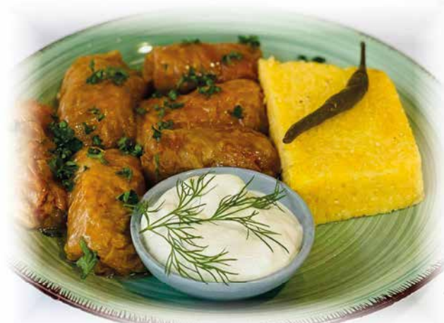
509) Rumänische Kohlrouladen