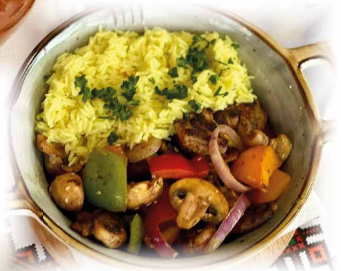
412) Pikante Pfanne mit Hähnchenbrust