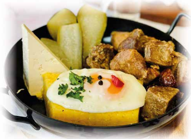
506) Transilvanische Pfanne