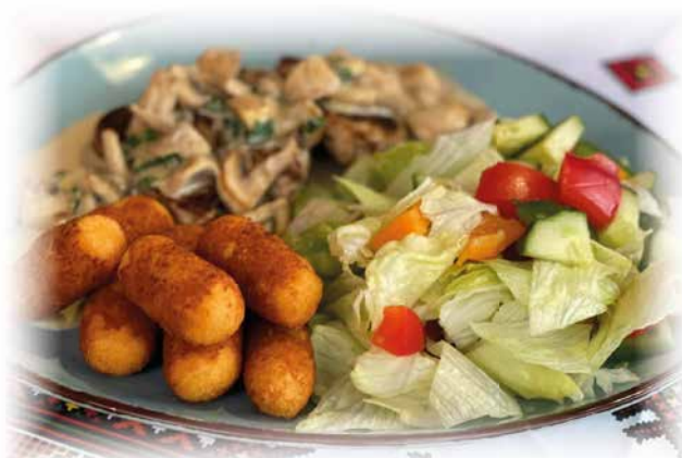
515) Schweinefilet mit Pilzen