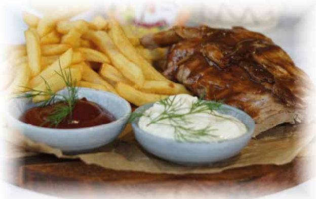
502) Schweinerrippen – aus dem Ofen